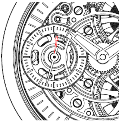
R&eacute;serve de marche (down) Remontez votre montre.

Wenn sich die Gangreserveanzeige (hier rot markiert) ihrem unteren Ende (down) nähert, ist es Zeit, Ihre Uhr aufzuziehen. Ziehen Sie Ihre Uhr vollständig auf, bis die Anzeige ihre Maximalposition (up) erreicht hat.