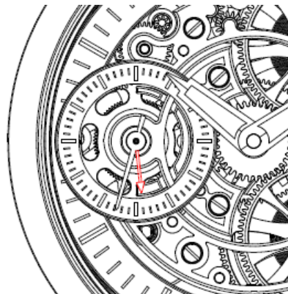
R&eacute;serve de marche (up) Votre montre est remont&eacute;e.

Gangreserve (down) Ziehen Sie Ihre Uhr auf